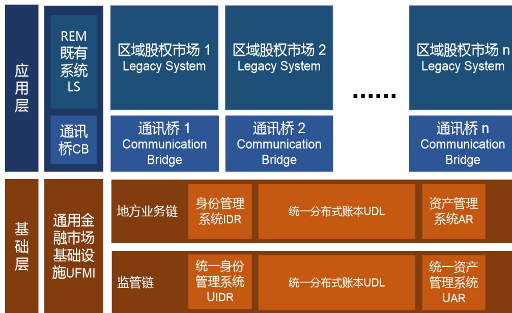
图 1 区域性股权市场的双层架构

区域性股权市场REM的既有系统LS（通过通讯桥CB）与通用金融市场基础设施UFMI共同构成两层体系：应用层与基础层，见图1。