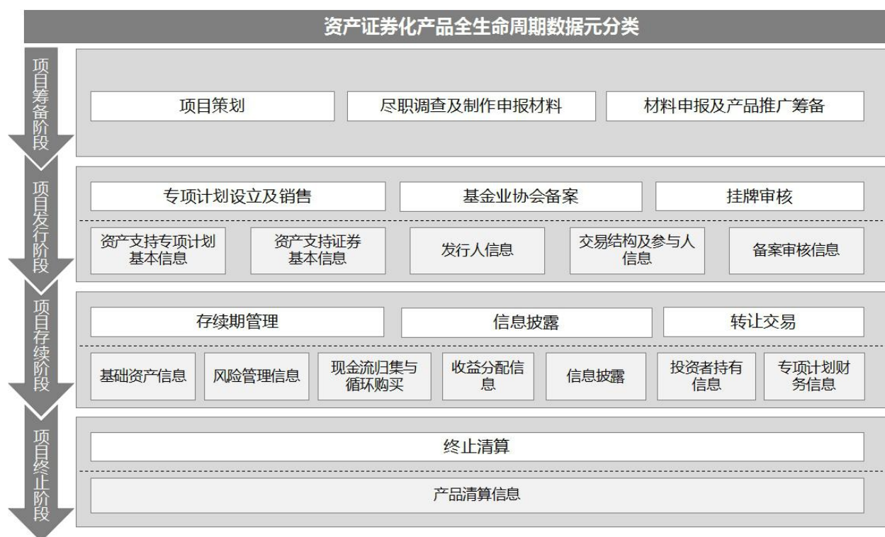
图 1 企业资产证券化业务数据元框架

d) 项目终止阶段：本阶段涉及的业务单元主要是终止清算，所产生的数据元列表是产品清算信息表。